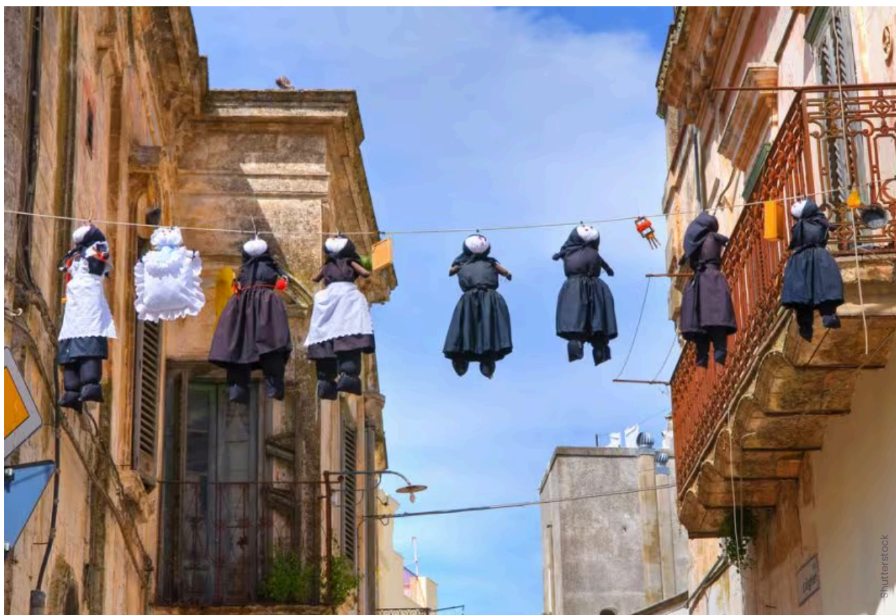
Borghi per la Befana

Nei borghi di tutta Italia i giorni intorno al 6 gennaio vengono organizzati eventi e manifestazioni per celebrare la nonnina volante che porta regali e carbone ai bambini.