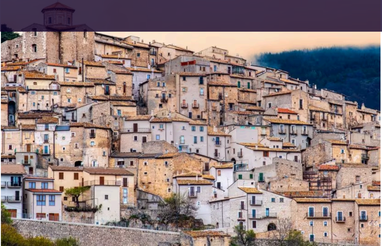
Castel del Monte

Spostandoci in Abruzzo tra Rocca Calascio e la Valle dell'Orfento troviamo borghi e paesaggi più montani ma altrettanto carichi di atmosfera genuina soprattutto durante il periodo dell'Epifania.