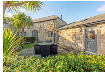
CORNWALL. En zona de Inglaterra puede arrendar propiedades históricas.