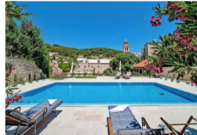
BRAC. En la isla croata recuperaron como hotel un palacio de 1467.

nutos al norte del río Campbell, el Dolphins Resort está justo frente al mar, con vistas al Discovery Passage—un canal entre las islas de Vancouver y Quadra— y a la Coast Mountain Range, que mezcla campos de hielo y montañas y volcanes.