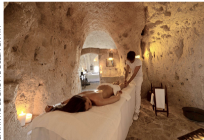
MATERA. Lujo en las "cavernas" del Sextantio Le Grotte della Civita.