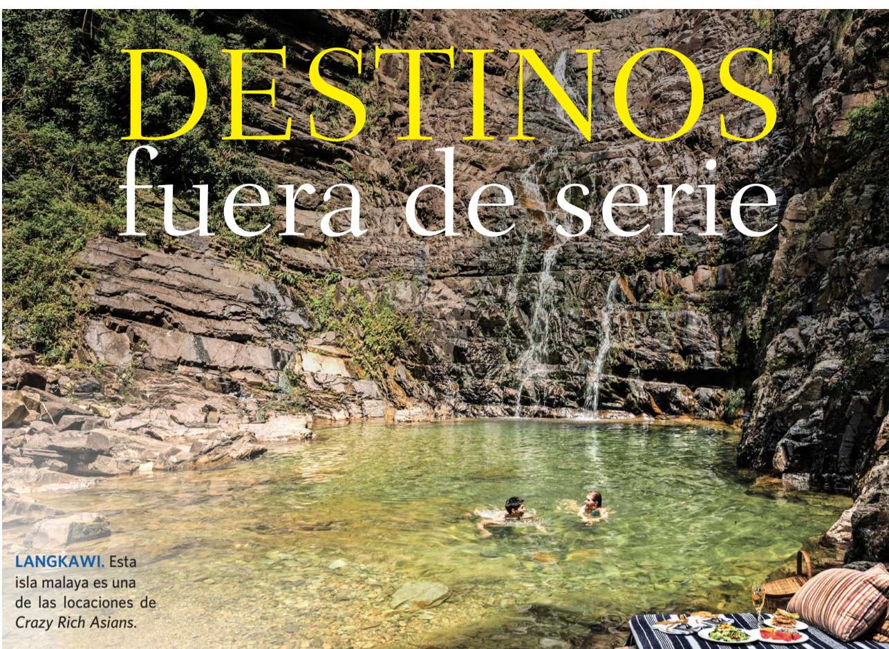
LANGKAWI. Esta isla malaya es una de las locaciones de Crazy Rich Asians.

Estas locaciones de películas y series han pasado de telón de fondo de la historia a destinos soñados, donde cualquier viajero podría fantasear con toparse a los protagonistas. Como para decir que la realidad supera a la ficción. POR Bárbara Bustos.