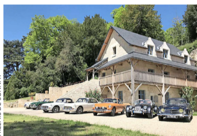
LOIRA. La colección de autos clásicos de Le Relais de Sonnay.

El futuro distópico de See, donde los humanos han perdido la vista, que se muestra en esta serie dramática de Apple TV+, protagonizada por Jason Momoa, se filmó principalmente en los prístinos paisajes canadienses del río Campbell y del Strathcona Provincial Park, en Vancouver, Columbia Británica.