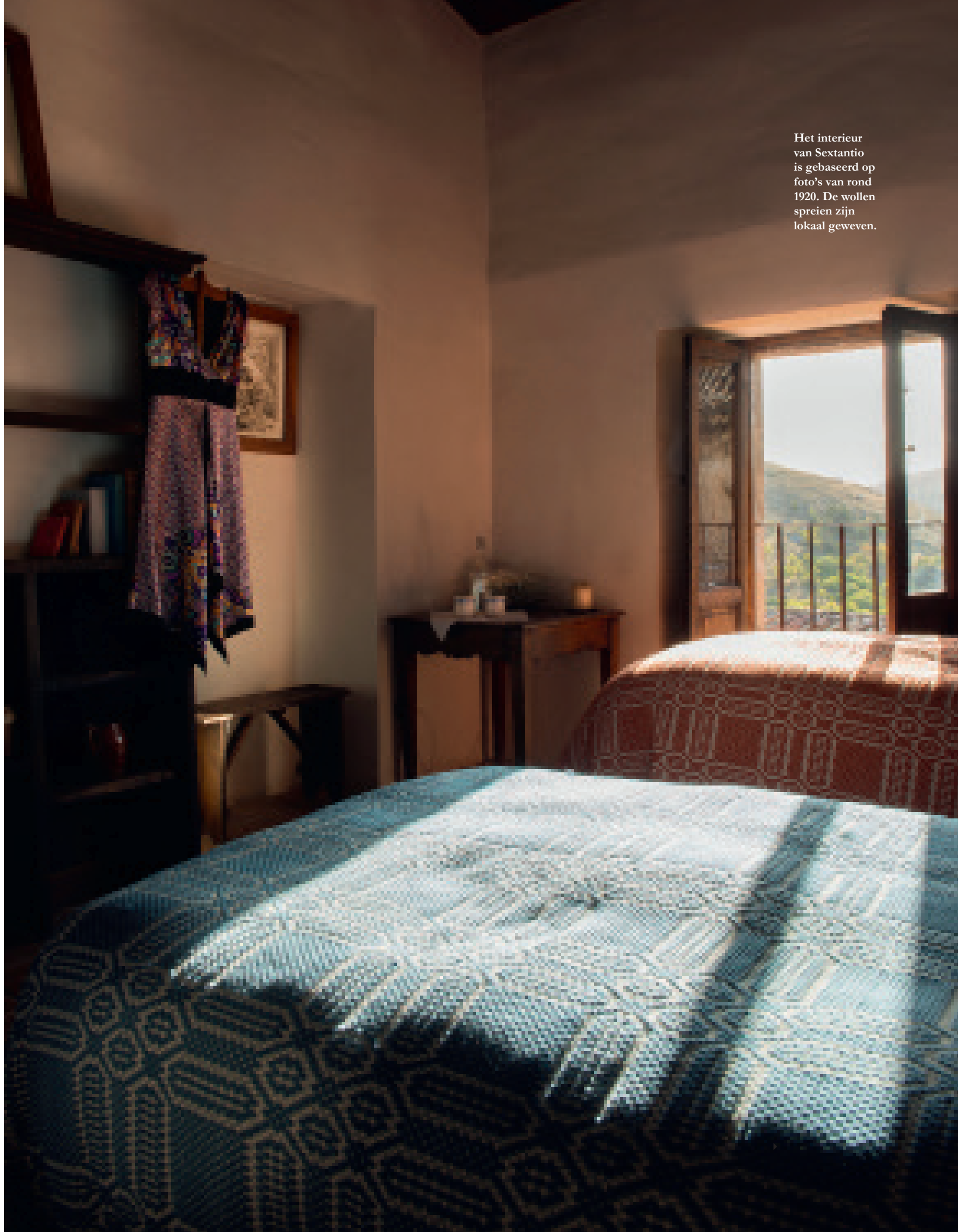
Het interieur van Sextantio is gebaseerd op foto's van rond 1920. De wollen spreien zijn lokaal geweven.