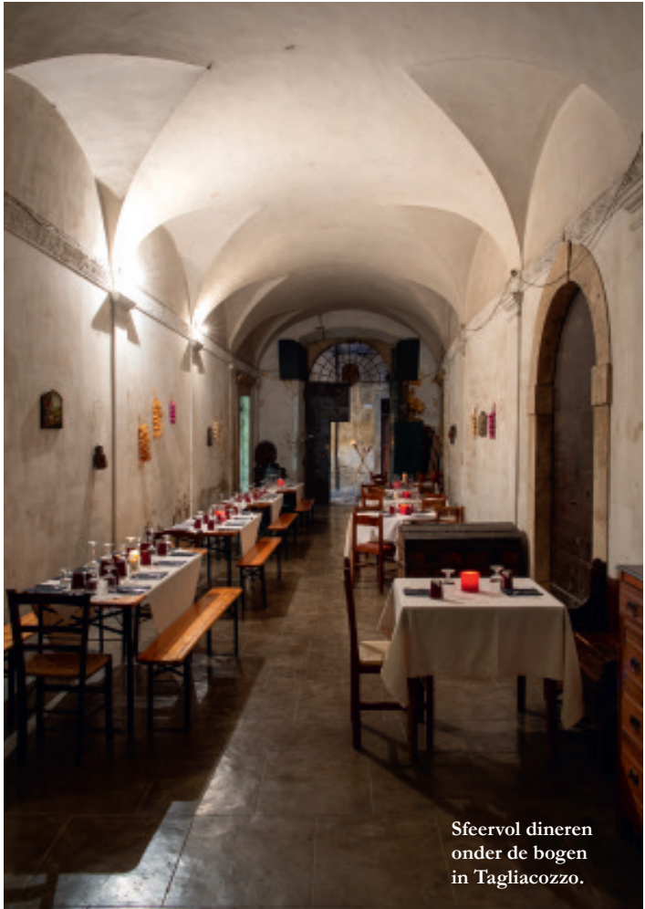
Sfeervol dineren onder de bogen in Tagliacozzo.