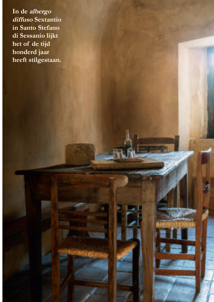
In de albergo diffuso Sextantio in Santo Stefano di Sessanio lijkt het of de tijd honderd jaar heeft stilgestaan.