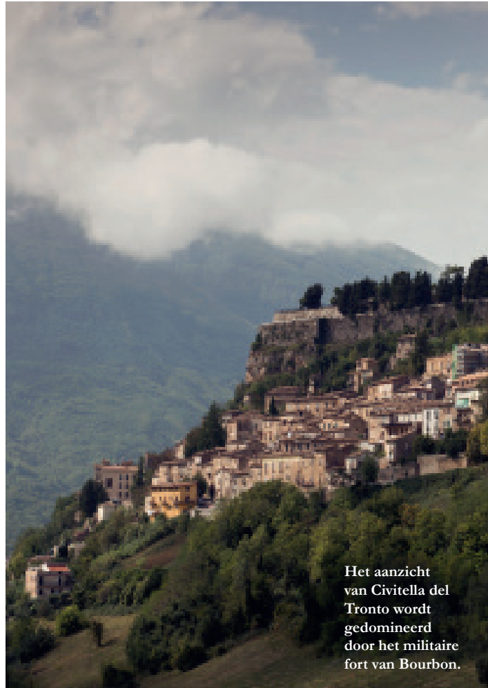
Het aanzicht van Civitella del Tronto wordt gedomineerd door het militaire fort van Bourbon.